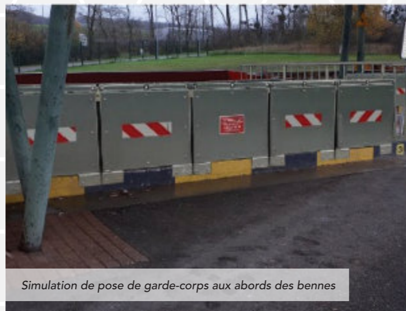
Simulation de pose de garde-corps aux abords des bennes

Des garde-corps fixes seront prochainement installés pour régler ce problème. Ils seront réalisés sur mesure pour combler les espaces dangereux, conformément aux normes sécuritaires obligatoires en déchèteries. Le service en sera amélioré pour les usagers et la gestion des lieux par les gardiens en sera plus efficace.