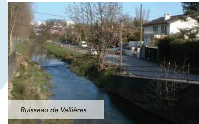
Ruisseau de Vallières

Le ruisseau de Vallières connaît régulièrement des inondations à Retonfey et Montoy-Flanville.