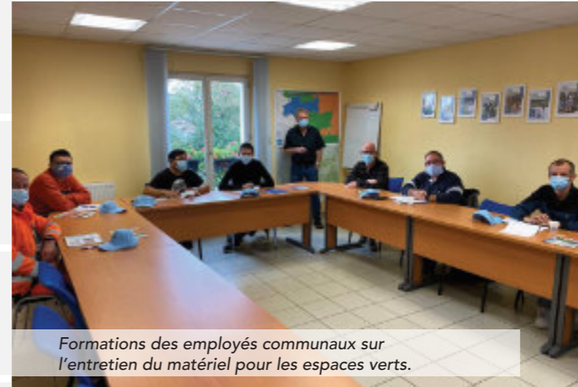
Formations des employés communaux sur l'entretien du matériel pour les espaces verts.

Pour professionnaliser les services, la CCHCPP établit chaque année un plan de formations ouvert à son personnel et à tous les agents des 28 communes . Ces actions collectives financées par la Communauté de communes sont construites en collaboration avec le CNFPT (Centre National de la Fonction Publique Territoriale). En 2020, 23 agents ont ainsi pu profiter de sept formations allant de la petite enfance à l'habilitation électrique en passant par des « trucs et astuces en bureautique ». Ces formations s'ajoutent à celles déjà proposées par les communes à leurs personnels.