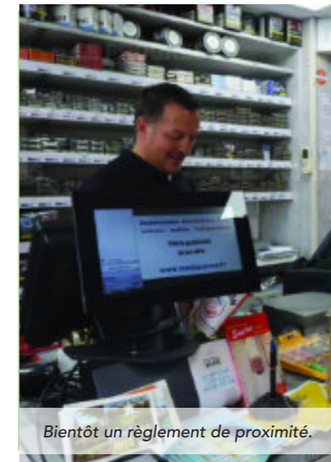
Bientôt un règlement de proximité.