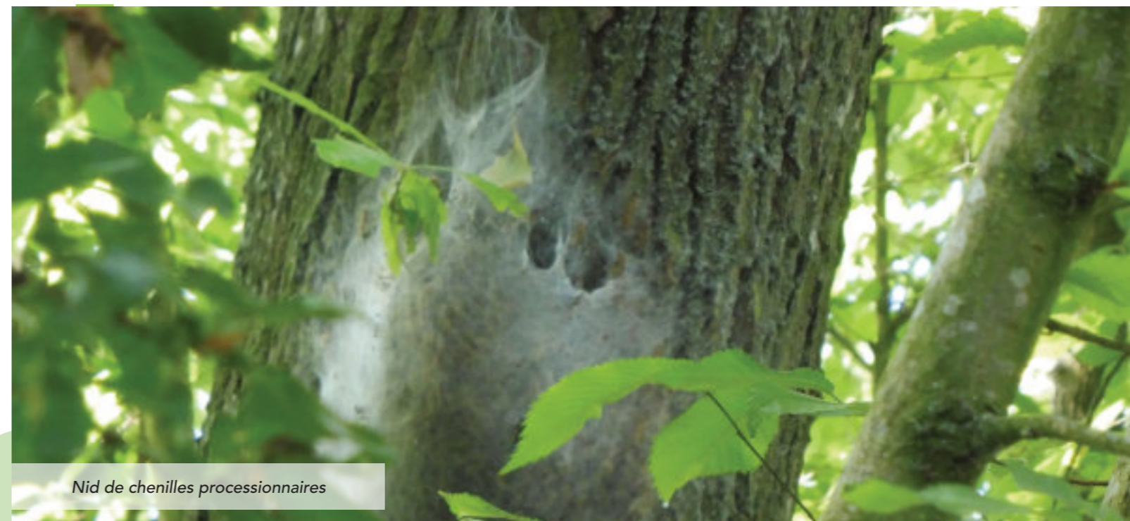
Nid de chenilles processionnaires

Depuis plusieurs années, la chenille processionnaire du chêne voit sa population augmenter. Sur le territoire de la Communauté de Communes Haut Chemin – Pays de Pange (CCHCPP), elle apporte avec elle son lot de nuisances, tant au niveau sanitaire qu'écologique.