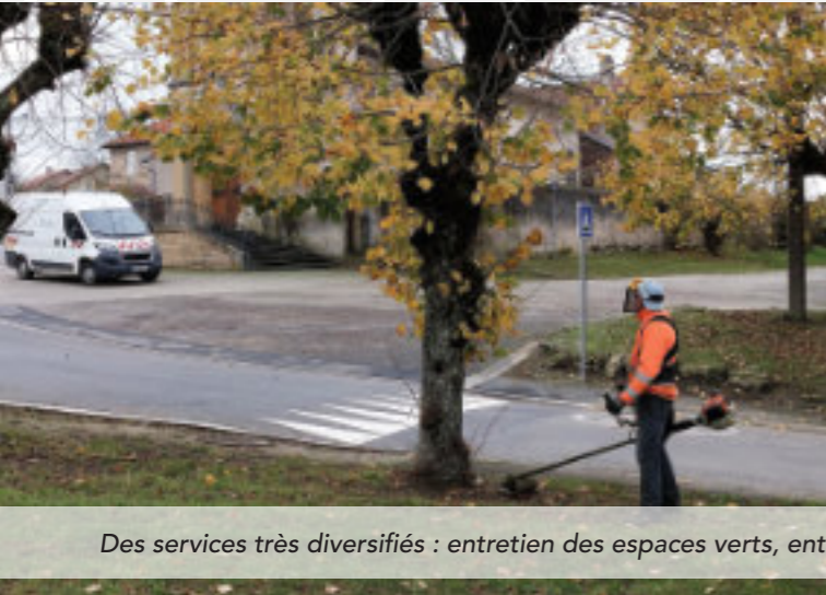
Des services très diversifiés : entretien des espaces verts, entretien du matériel, aide administrative...

Les 28 communes qui composent l'intercommunalité sont des collectivités de taille hétérogène. Leurs ressources et leurs fonctionnements diffèrent de l'une à l'autre.