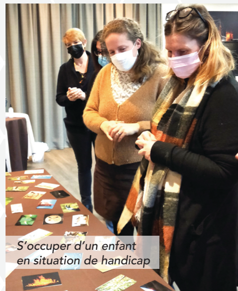
S'occuper d'un enfant en situation de handicap