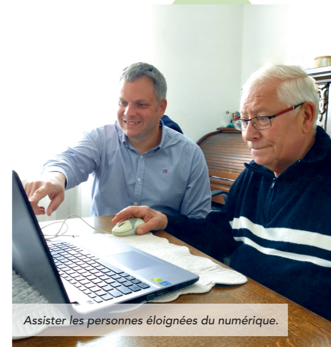
Assister les personnes éloignées du numérique.

Depuis 2020, les 28 communes de la Communauté de communes Haut Chemin-Pays de Pange (CCHCPP) ont accès à internet à très haut débit. La CCHCPP a été la toute première intercommunalité du Grand Est dont tous les foyers sont raccordés à la fibre. Deux tiers des familles du territoire ont déjà souscrit une offre à très haut débit auprès de l'un des principaux opérateurs français, Orange et SFR, tous les deux présents sur le territoire. De nouveaux usages du numérique vont donc pouvoir se développer. Une des premières expérimentation en la matière, conduite par Moselle Fibre sur le territoire de la CCHCPP, consiste à pucer les conteneurs à verre installés dans les communes.