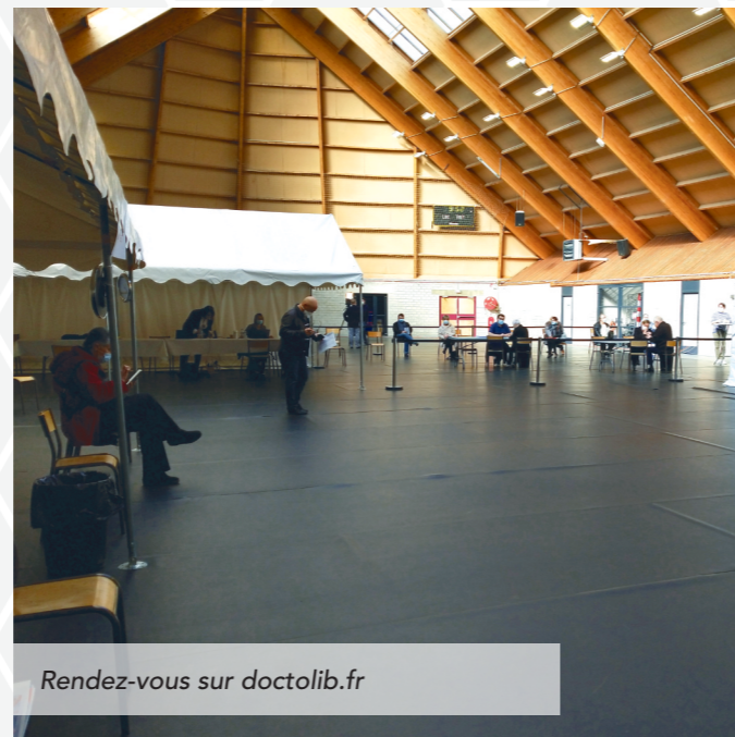
Rendez-vous sur doctolib.fr

Un centre de vaccination contre la Covid-19 a ouvert jeudi 18 mars dans la salle polyvalente de Courcelles-Chaussy. À l'initiative de la communauté de communes, l'équipe municipale et les agents communaux de Courcelles-Chaussy se sont mobilisés pour relever le défi d'ouvrir rapidement ce centre autorisé par la Préfecture quelques jours auparavant. La campagne de vaccination s'est rapidement accélérée. Au 30 avril, 3000 personnes ont pu être vaccinés sous Moderna. Pour le mois de mai, 5000 vaccinations sont prévues avec le vaccin Pfizer. D'autres médecins ont rejoint l'équipe de bénévoles, ce qui permet de gérer plusieurs rendez-vous à la fois. Les membres du Centre Communal d'Action Sociale de Courcelles-Chaussy et les agents de la CCHCPP se relaient également pour y accueillir le plus grand nombre. Depuis le 4 mai, le centre est ouvert 6 jours sur 7.