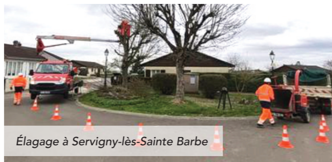
Élagage à Servigny-lès-Sainte Barbe

En ce début de printemps, les agents des services techniques de la CCHCPP réalisent, dans certaines communes, des travaux sur les espaces verts dans le cadre de la mutualisation des services. Ceux-ci concernent généralement des entretiens réguliers tels que la tonte ou la taille de végétaux. Les 18 communes du territoire qui ont signé une convention avec la CCHCPP peuvent ainsi bénéficier de ces prestations pour rendre leur village agréable pour la période estivale. L'ensemble de ces prestations a démarré au début du mois d'avril et se poursuivra jusqu'à la fin de l'automne.