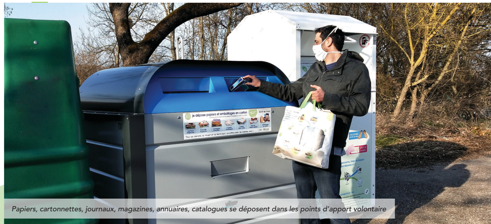
Papiers, cartonnettes, journaux, magazines, annuaires, catalogues se déposent dans les points d'apport volontaire

Le déploiement de la nouvelle collecte de proximité à destination des fibreux (journaux, papiers, revues, cartonnettes) connaît un franc succès. Depuis sa mise en place le 1 er janvier, les habitants du territoire ont pris l'habitude de déposer leurs déchets fibreux recyclables aux points d'apport volontaire de leurs communes et ceci malgré la poursuite de la collecte en porte à porte jusqu'à la fin du mois d'avril.