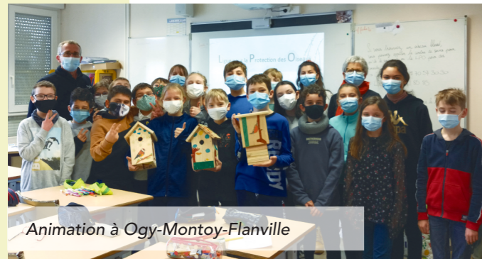
Animation à Ogy-Montoy-Flanville

La Communauté de Communes Haut Chemin-Pays de Pange (CCHCPP), en collaboration avec la Ligue de Protection des Oiseaux (LPO), a organisé des animations de sensibilisation à la lutte contre les chenilles processionnaires dans les écoles. Les enfants ont pris conscience des enjeux écologiques qui se jouent sur leur territoire à travers les ateliers proposés. Ils se sont ensuite pleinement investis dans la décoration et la construction des nichoirs pour les mésanges charbonnières très friandes de chenilles, et des gîtes à chauve-souris, prédatrices de leurs papillons de nuit. Ces abris ont été installés dans leurs communes, à proximité des écoles et sont déjà habités.