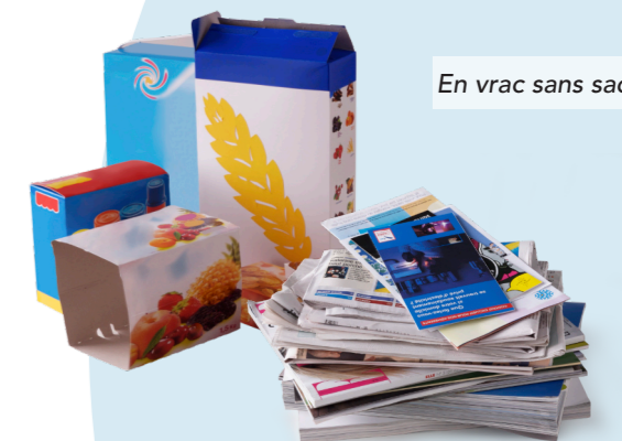
En vrac sans sac

Face à l'engouement positif qu'a engendré la mise en place des points d'apport volontaire, un supplément de colonnes aériennes a été commandé pour compléter le parc.