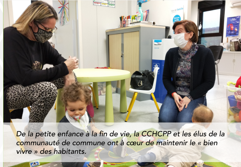
De la petite enfance à la fin de vie, la CCHCPP et les élus de la communauté de commune ont à cœur de maintenir le « bien vivre » des habitants.

Durant tout l'automne 2021, les élus de la Communauté de Communes Haut Chemin - Pays de Pange ont participé à des ateliers de réflexion sur le futur de leur territoire . L'objectif de ces séances de travail était de préparer le Pacte Territorial de Relance et de Transition Écologique (PTRTE) signé avec l'État et la Région Grand Est à Bouzonville le 14 décembre dernier.