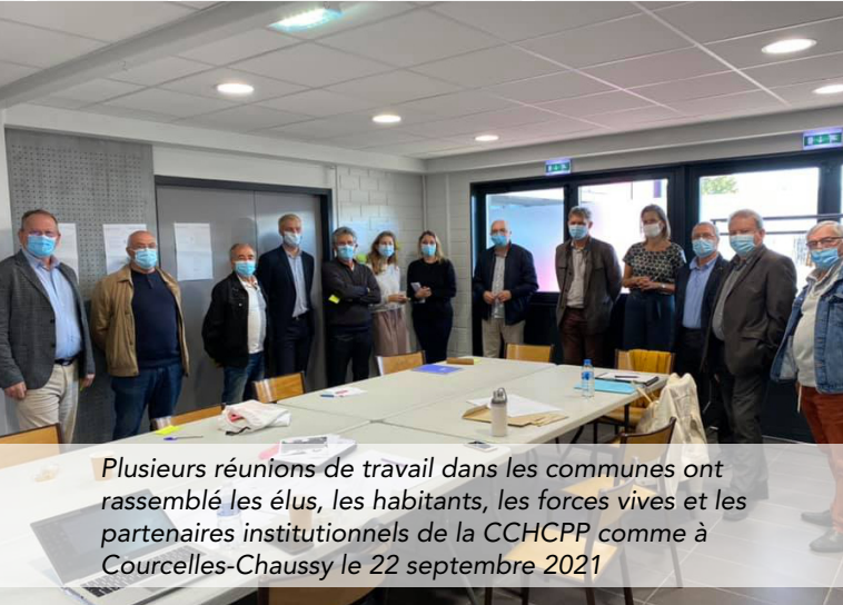
Plusieurs réunions de travail dans les communes ont rassemblé les élus, les habitants, les forces vives et les partenaires institutionnels de la CCHCPP comme à Courcelles-Chaussy le 22 septembre 2021