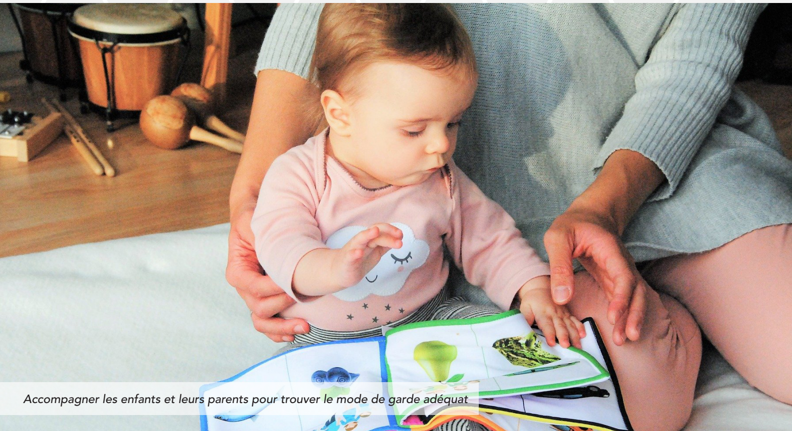
Accompagner les enfants et leurs parents pour trouver le mode de garde adéquat

La CAF (Caisse d'Allocations Familiales) soutient les collectivités locales qui s'engagent pour mieux répondre aux besoins de leurs habitants. Aussi la CCHCPP a-t-elle signé avec elle une Convention Territoriale Globale (CTG), qui va notamment impacter le Relais Petite Enfance (RPE – ex RPAM).