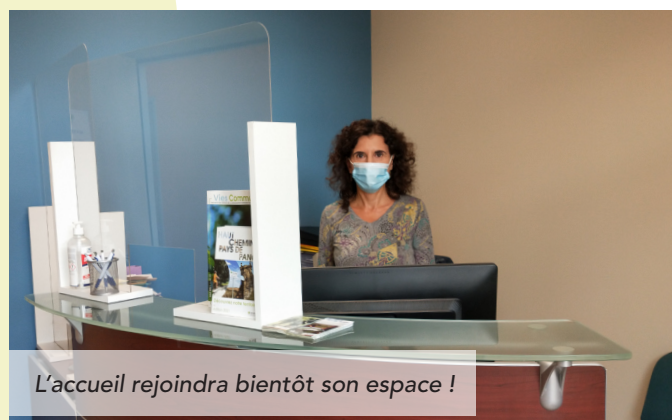
L'accueil rejoindra bientôt son espace !

Les travaux du siège de la Communauté de communes au 1 bis route de Metz à Pange sont terminés. Les nouveaux locaux peuvent désormais accueillir les habitants du territoire dans des conditions optimales. Chaque service est bien identifié pour répondre au mieux aux attentes de chacun. Sur ce site, on retrouve les services concernant les ordures ménagères, l'eau, l'assainissement, l'urbanisme mais aussi tout ce qui touche à l'environnement et à l'aménagement du territoire. Un bureau est d'ailleurs prévu pour accueillir le syndicat des eaux vives des 3 Nied. Un technicien détaché sera présent régulièrement.