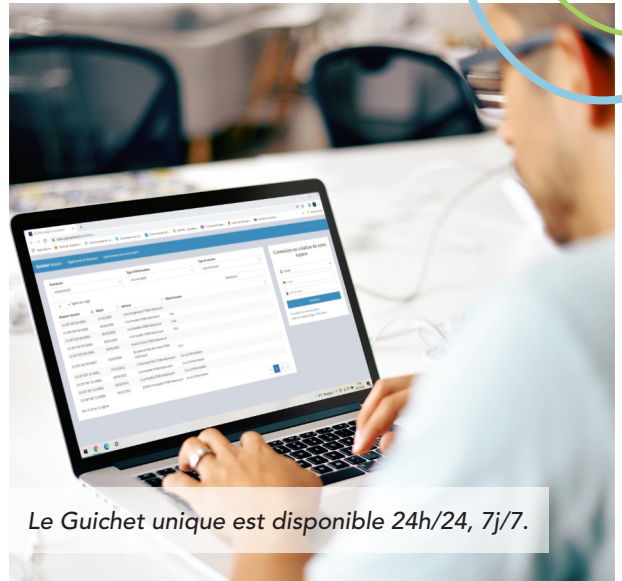
Le Guichet unique est disponible 24h/24, 7j/7.

> Pour déposer un dossier : cchcpp.fr/rubrique/urbanisme