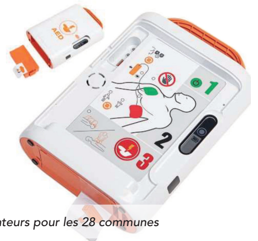
Des défibrillateurs pour les 28 communes

En parallèle à cette action, les élus de la CCHCPP ont voté l'achat et l'entretien de défibrillateurs . Ces derniers seront prochainement installés dans chaque commune ainsi que dans leurs annexes.