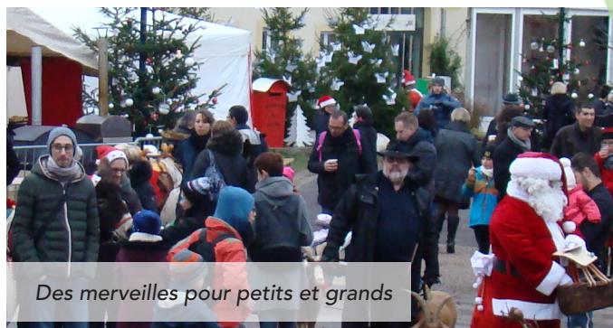
Des merveilles pour petits et grands

La commune de Courcelles-sur-Nied s'est parée de son habit de lumière les 11 et 12 décembre derniers. Les bénévoles se sont mobilisés pour transformer le village de 1200 habitants afin qu'il soit étincelant. La pause de 2020 a rendu d'autant plus appréciables les moments conviviaux de 2021. Plaisir de se retrouver, d'échanger mais aussi de découvrir comme à chaque manifestation depuis 18 ans , les décorations lumineuses, d'écouter des chorales ou de boire un bon vin chaud dans un des chalets de cette fête de Noël rustique. Le temps du week-end, les visiteurs ont pu déguster des produits du terroir, partager un moment avec des artisans locaux ou avec le Père Noël ! Magie, rêve et convivialité étaient bien présents pour commencer la période des fêtes. > Manifestation soutenue par la CCHCPP